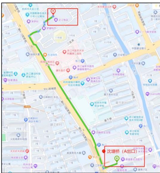
“沈塘桥”（A 出口）地铁站→之江饭店