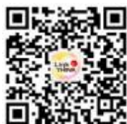
外研社高等英语资讯